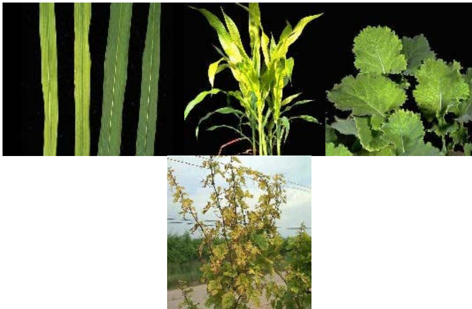
3. ábra Jellegzetes Fe hiánytünetek (gabonafélék, kukorica, repce, szőlő)

Vashiány esetén (3. ábra) a növény klorofiltartalma csökken és a fehérjeszintézis gátolttá válik. A hiány jellegzetes tünete a klorózis. A fiatal levelek érkezei világosodnak, sárgulnak, míg az erek zöldek maradnak. Egyszikűeknél jellegzetes hosszanti levélsíkozottság jelentkezik. Súlyos hiány esetén a levelek szinte teljesen kifehérednek és a levelek erezte sem különül el a levéllemez többi részének színétől.