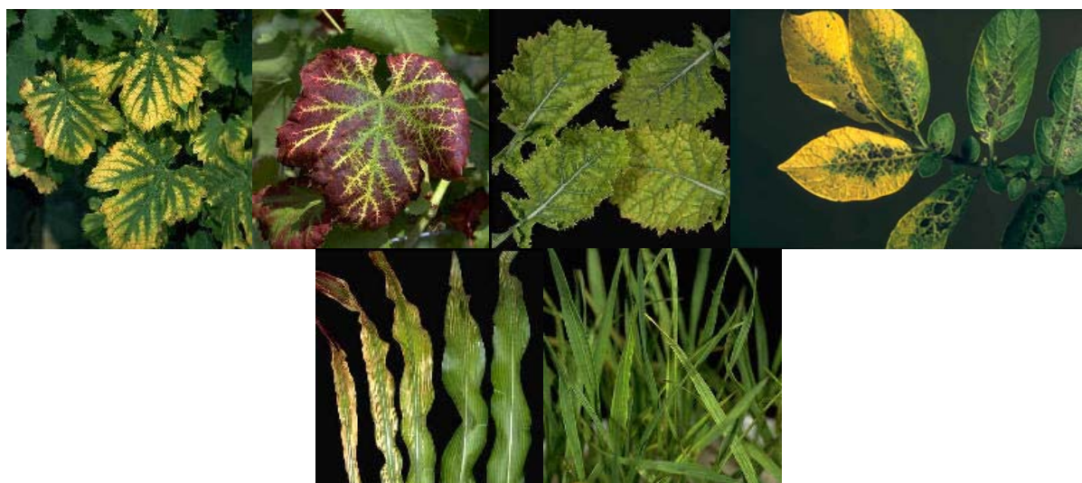
2. ábra: Mg hiánytünetek (szőlő, repce, burgonya, kukorica, gabonafélék)