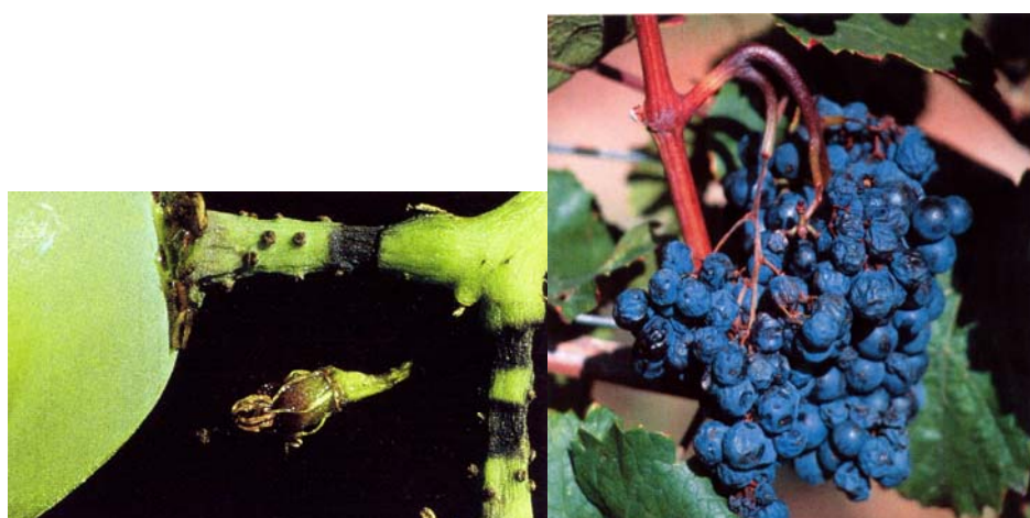
3. ábra: A szőlő fürtkocsánybénulása

A rendszeresen elvégzett talajvizsgálatok mellett termesztett növényeink tápelem (így Mg) ellátottságáról a megfelelő időpontban, szakszerűen elvégzett növényvizsgálatok eredményeiből tájékozódhatunk.