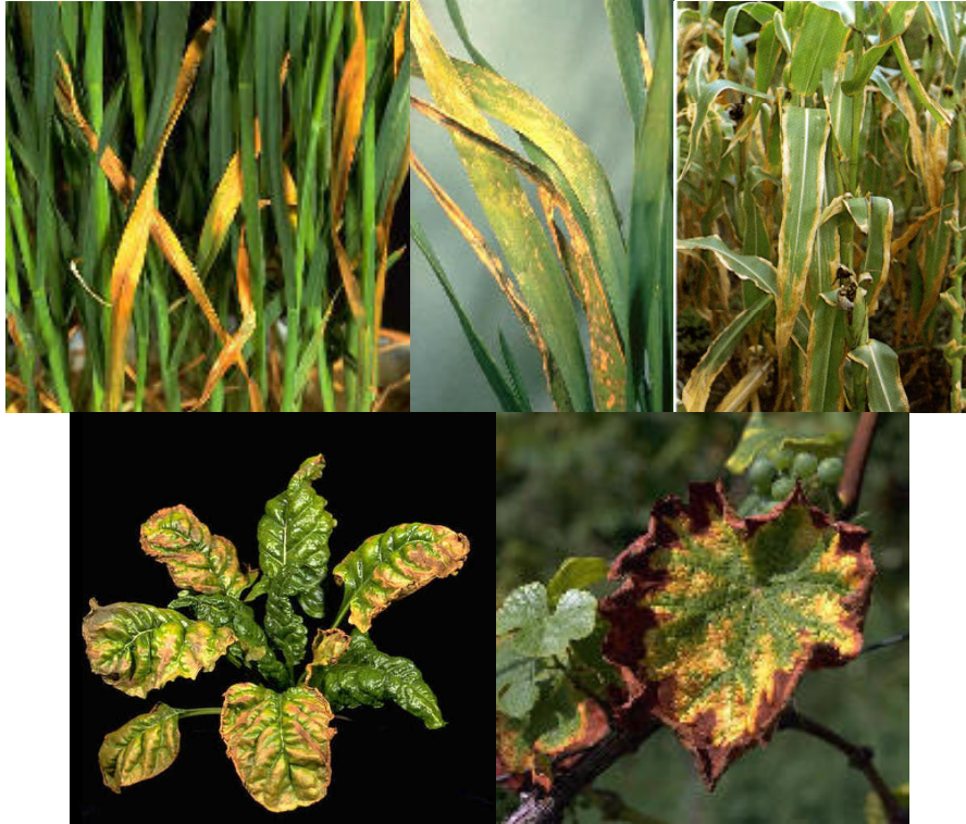
2. ábra: A káliumhiány jellemző tünetei (búza, kukorica, répa, szőlő)